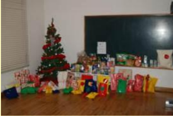
As prendinhas ☺